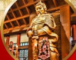
ขอพรโชคลาภ การเงินและธุรกิจ