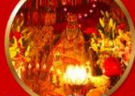
นมัสการองค์เจ้าแม่กวนอิม ที่มีอายุกว่า 600 ปี