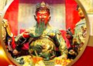
นมัสการเทพเจ้ากวนอู ขออำนาจและบารมี