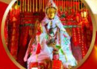
โชคลาภ และความมั่งคั่ง