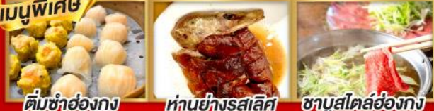
ติ่มซำฮ่องกง