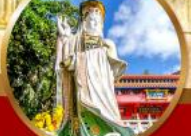
สุขภาพแข็งแรง และอายุยืน